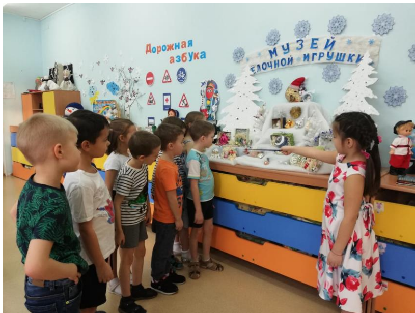
Музей "Ёлочной игрушки"