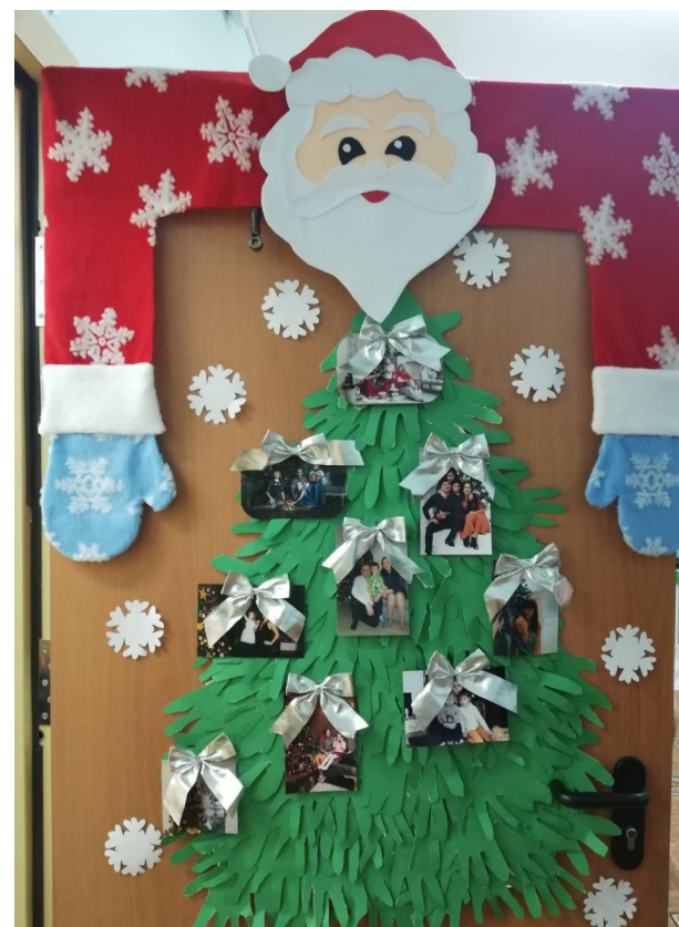
Оформление стенгазеты "Новый год - семейный праздник"